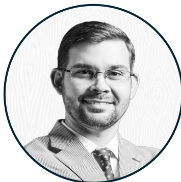
Director Ejecutivo APP Quisqueya