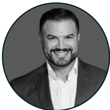
Gerente General Fiduciaria Reservas